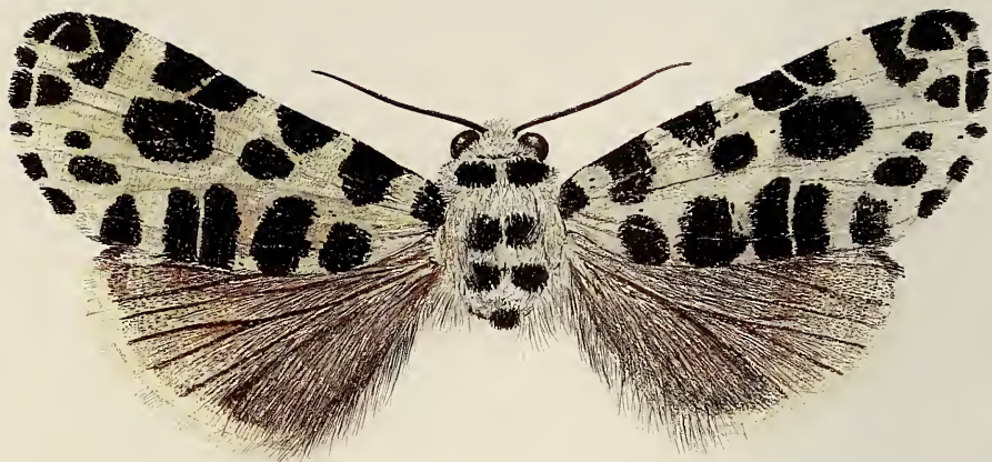
Abb. 1. Clethrorasa kossnerae , spec. nov. ♂ Holotypus (Zeichnung R. Kühbandner).

Daten wie Holotypus, coll. Krusek, Prag; 1♀, [China] Linping, Pr. Kwangtung, 9.5.1992, [leg.] H. Höne, ZFMK, Bonn. 2♂♂, N. Vietnam, 1600 m, Mt. Fan-si-Pan (Nord) Cha-pa, Primärwald, 22°17'N, 103°44'E, 20.30.4.1995, leg. Sinajev & einh. Sammler, coll. Hreblay, M.-Erd.)